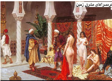
حرمسرای مشرق زمین

هزاران دختر جوان و خوش صورت را بعنوان هدیه بدربار خلفای بغداد روان می نمودند و اکثریت حرمسراها تا حدود ده الی دوازده هزار زن محبوس داشت، زمانیکه اعراب از طرف غرب به افغانستان تاختند و زنان را در جمله اسیران جنگی به کنیزی گرفتند، بدربار خلفا و امرای بزرگ عرب رسیدند، به طور مثال در مصر عباسیان، از زنان ملل مختلفه در دربار و خانه های امرا آنقدر زیاد بود که عبدالله بن طاهر فوشنجی چهارصد دوشیزه نوجوان را بدربار خلیفه بغداد از خراسان فرستاده در حالیکه او چهار هزار زن دیگر هم داشت. والرشد خلیفه دو هزار زن داشت و ازین زنها برخی چنان بودند که قیمت شان! تا یک میلیون دینار میرسد از روی اسناد رسمی احصائیه عایدات مالی دربار خلافت حدود ۲۳۲ هه مطابق ۸۴۶ م که تدوین گردیده، در قسمت درآمد مالی سرزمین های مشرقی خلافت عباسی ضبط گردیده که از کابل دوهزار کنیز، غزی بقیمت ششصد هزار درهم بدربار خلافت فرستاده شد.