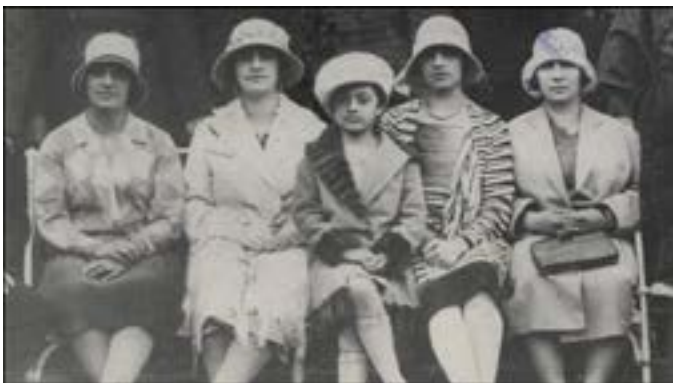
خانواده امان الله خان - ۱۲۹۸ ش