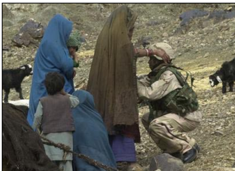
نیروهای امپریالیستی اشغالگر در اثناء تلاشی زنان در ولایت ننگرهار - افغانستان

دشمن خود به خود از بین نمی رود. نه نیروهای متجاوز امپریالیزم امریکا در افغانستان و نه مرتجعین میهن فروش و بنیاد گرا در کشور، هیچکدام به دلخواه خود از صحنه تاریخ خارج نخواهند شد. بر ماست که خلق را متشکل کنیم. بر ماست که خلق را متشکل کنیم تا امپریالیستها و مرتجعین را واژگون سازد. تمام پدیده های امپریالیستی - ارتجاعی با هم یکسانند؛ اگر آنها را نزدیک ساقط نخواهند شد. این درست مانند جاروب کردن کف اتاق است - علی القائده خس و خاشاک از جایی که جاروب نشود به خودی خود زایل نمی گردد. نفرت و انزجار خویش را به مقاومت ملی، مردمی و انقلابی علیه اشغالگران امپریالیست و خائنین ملی دست نشانده اش متمرکز نماییم.