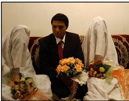
هرگاه کوچکترین حرکتی از زنان در این باره

کاریکه امروز ملاحی شیعیه به حمایت رژیم پوشالی انجام داده و زنان را از حقوق شهروندی محروم ساخته اند و این نهاد را قانونی اعلام نموده اند. این قانون بیشتر به مردان اجازه داده تا از جنس زن لذت برده، کامجویی نمایند و به ازدواج‌های گروهی روی آورند. در حقیقت امر، امروز در افغانستان فحشا از طرف رژیم پوشالی و بنیاد گرایان مذهبی قانونی اعلام گردیده است. برای مردان این مزیت داده می‌شود که از ازدواج‌های گروهی لذت ببرند. اما زنان بیش از پیش از این آزادی محروم می‌شوند. در حقیقت امر ازدواج گروهی تا همین امروز هم برای مردان وجود دارد. چیزیکه برای یک زن جنایت محسوب می‌شود و شدیدترین عواقب قانونی و اجتماعی را در بردارد. اما برای مردان افتخار است و حداکثر یک لکه اخلاقی کم‌رنگ محسوب می‌شود که او بادل و جان و بالذت تمام آنرا می‌پذیرد.